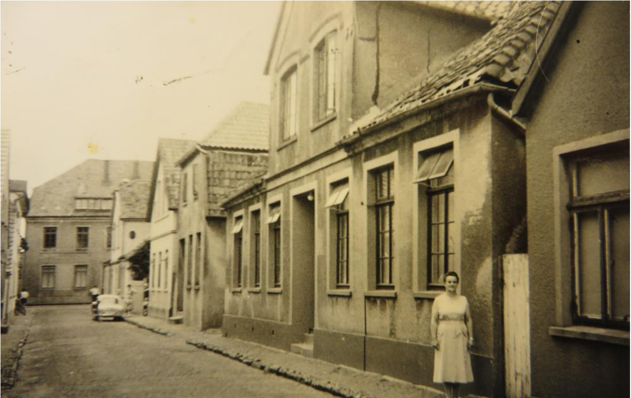
Abb. 11: Varel, Schüttingstraße. Die Person auf dem Foto steht vor der Hausnummer 13, dem ehemaligen Jüdischen Altenheim (1937 bis 1942), 1939 bis 1942 Aufenthaltsort von Karl Anton Lehmann. Ein zeitgenössisches Foto aus dem Zeitraum 1937 bis 1942 ist bisher unbekannt.