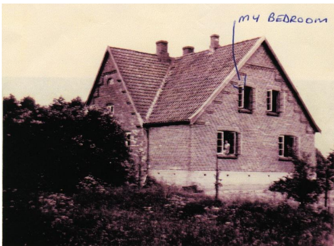
Abb. 6 / 7: Wohnhaus Familie Lehmann, Tremsbüttel, Kiebitzmoor. 1930er Jahre ( http://www.lifehistoriesarchive.com/exhibits/show/peter-layton ).