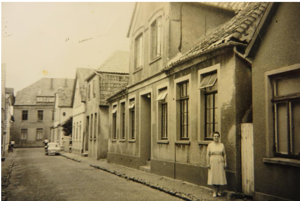
Abb. 8: Varel, Schüttingstraße. Die Person auf dem Foto steht vor der Hausnummer 13, dem ehemaligen Jüdischen Altenheim (1937 bis 1942), Juni/Juli 1939 Aufenthaltsort von Mathilde Schwarz. Ein zeitgenössisches Foto aus dem Zeitraum 1937 bis 1942 ist bisher unbekannt (Arbeitskreis Weinberghaus Varel).