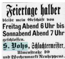
Abb.: „Norddeutsches Volksblatt“, 27. September 1895.