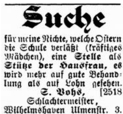
Abb.: „Der Israelit“, 21. März 1901.