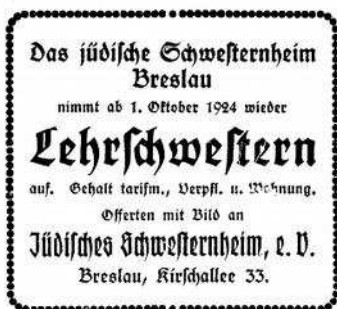
Abb.: Anzeige in „Breslauer Jüdisches Gemeindeblatt“, 8. August 1924.