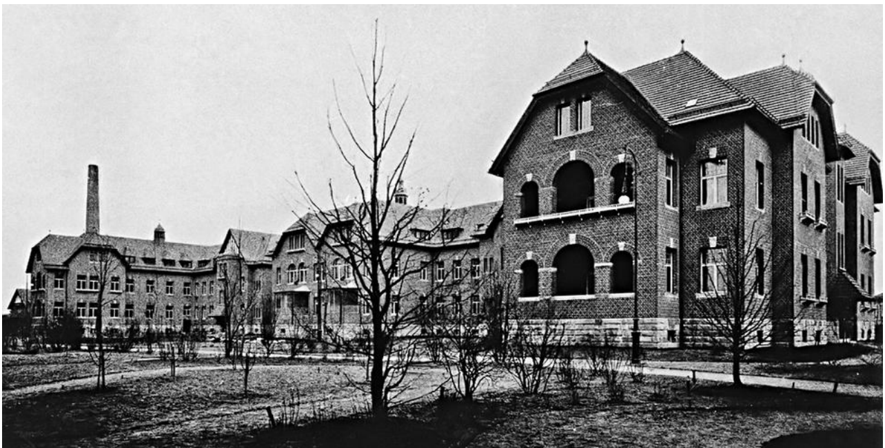
Abb.: Hauptgebäude des Jüdischen Krankenhauses Breslau.

Für eine Frau aus einem jüdischen Elternhaus bestand in der ersten Hälfte des 20. Jahrhunderts noch immer die schwierige Situation, dass die professionelle Krankenpflege in Deutschland weitgehend durch katholisch oder evangelisch geprägte Schwesternschaften bzw. deren sogenannte Mutterhäuser ausgeübt wurde. Um auch jüdischen Frauen den Zugang zur Krankenpflege zu ermöglichen und um in den jüdischen Krankenhäusern nicht auf nichtjüdisches Pflegepersonal angewiesen zu sein, hatte sich allerdings bereits auch ein eigenständiges jüdisches Ausbildungswesen etabliert. 1898 gründete sich in Breslau der „Verein für ein Jüdisches Schwesternheim“ und 1903 wurde das jüdische Schwesternheim in der Kirschallee 33 feierlich eröffnet. Es lag unmittelbar in Nachbarschaft zum Jüdischen Krankenhaus. 10