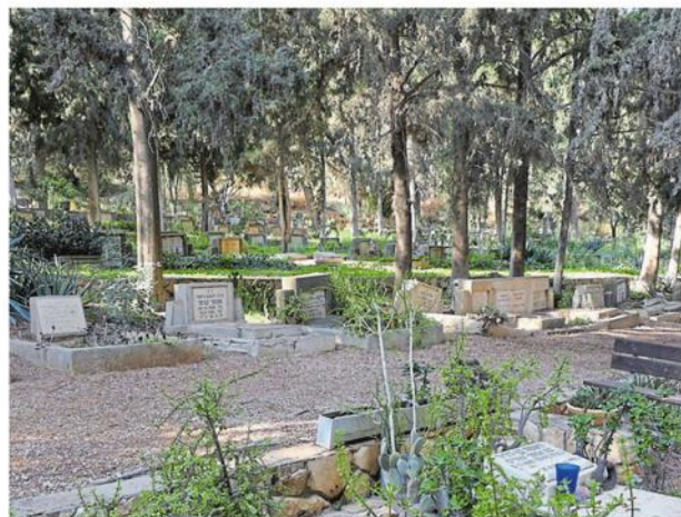
Der Friedhof im Kibbuz Beit Alfa in Israel

damals schlesischen und heute polnischen Breslau (Wroclaw) sowie einem sich anschließenden Aufenthalt in Berlin von Varel aus über Genua ins damalige britische Mandatsgebiet Palästina ausgewandert – in den Kibbuz „Beit Alfa“. Dieses Vorhaben müsse sie lange geplant und mithilfe entsprechender Kontakte organisiert haben, erläutert Holger Frerichs