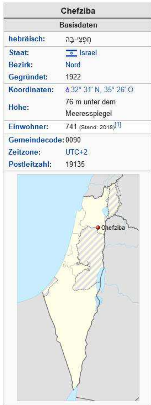
Abb.: Geografische Lage Kibbuz Beit Alfa und Kibbuz Chefziba. Wikipedia.