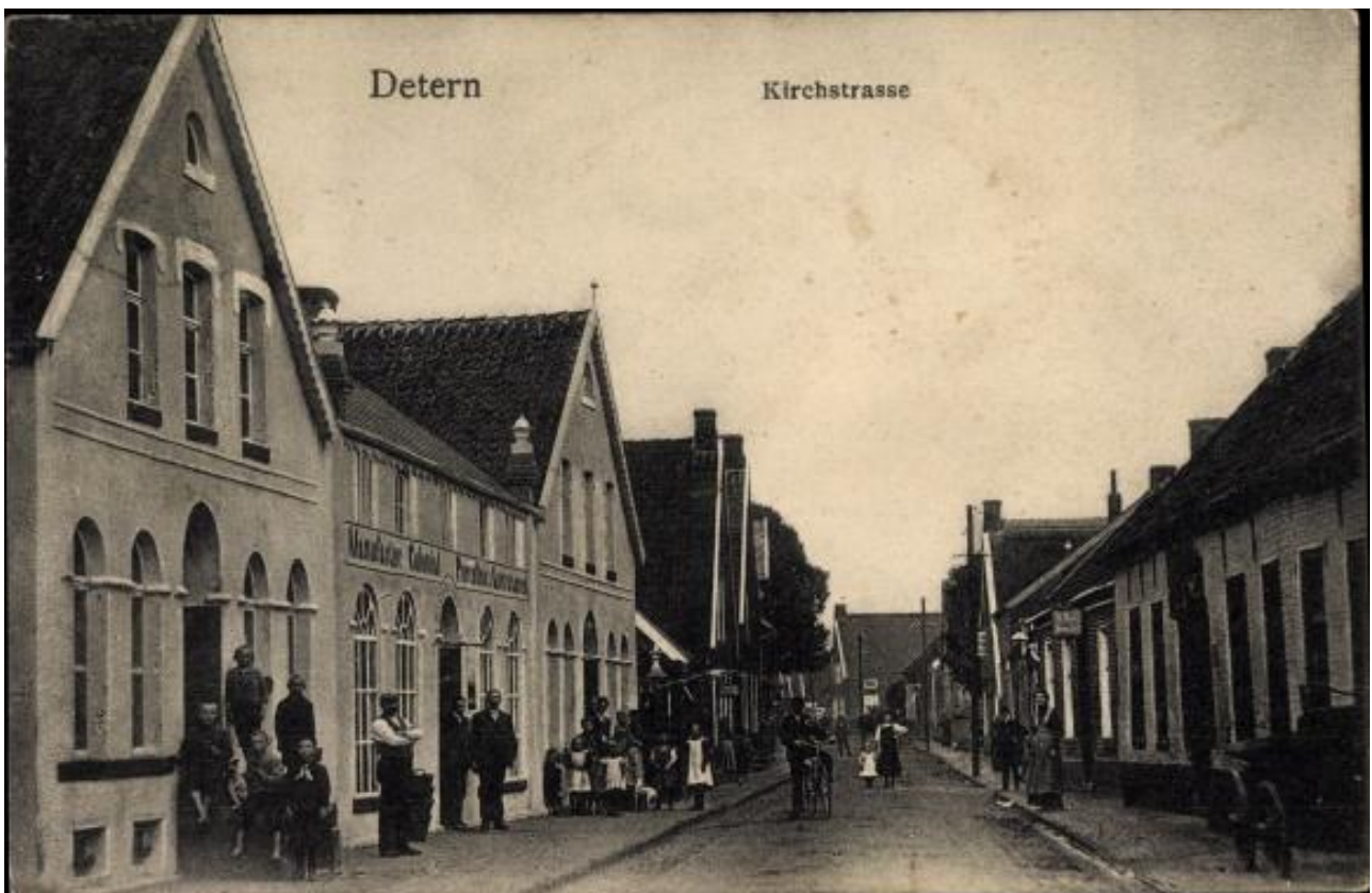
Abb.: Ortschaft Detern, Wohnort der Weinbergs bis 1905. Postkarte von 1912. Sammlung Frerichs.