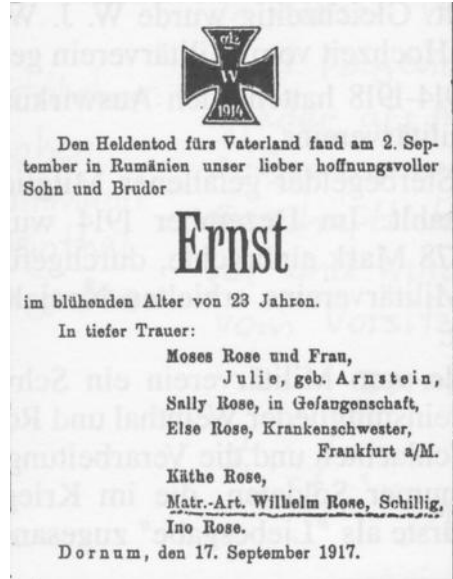
Abb. aus: Die Juden in der ostfriesischen Herrlichkeit Dornum (1662-1940). Westerholt 1995, Seite 120.