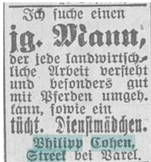
Abb.: „Nachrichten für Stadt und Land“, Oldenburg, 27. Februar 1922.