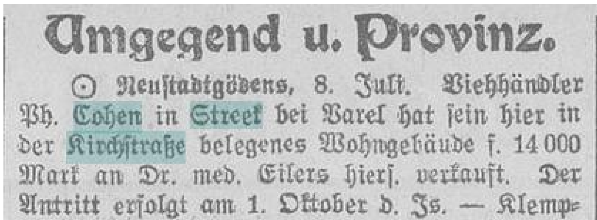
Abb.: Notiz in „Wilhelmshavener Tageblatt“, 10. Juli 1919.