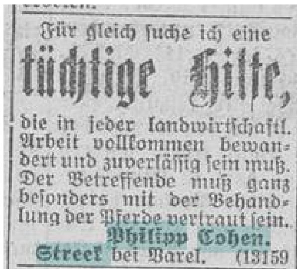
Abb.: „Jeversches Wochenblatt“, 30. August 1921.