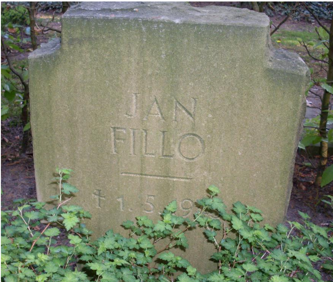
Abb. 2: Grabstein Jan Fillo, evangelisch-lutherischer Friedhof in Varel.