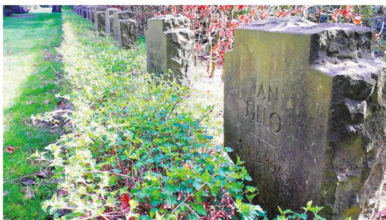
Das Grab von Jan Fillo befindet sich in der Reihe der „Kriegsgräber“ auf dem Varelener Friedhof.

Nach der Gefangennahme wurden sie im Oktober 1944 in Lamsdorf mit einer Erkennungsnummer des (eigentlich schon längst aufgelösten und dem Stalag 344 zugeordneten) Stalag 318 registriert und Mitte Dezember – wohl im Zusammenhang mit der beginnenden Evakuierung des Lagers – zum Stalag X B Sandbostel versetzt. Mit dem Einsatz in Varel (Friesland) müsste dann wohl noch eine Versetzung zum Stalag X C Nienburg, das die im Arbeitseinsatz im hiesigen Gebiet eingesetzten Kriegsgefangenen karteimäßig verwaltete, erfolgt sein.