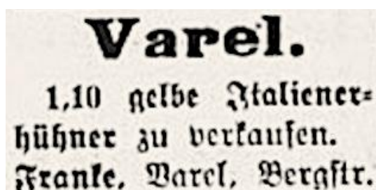
Abb.: „Republik“, Rüstringen, 6. Februar 1929.